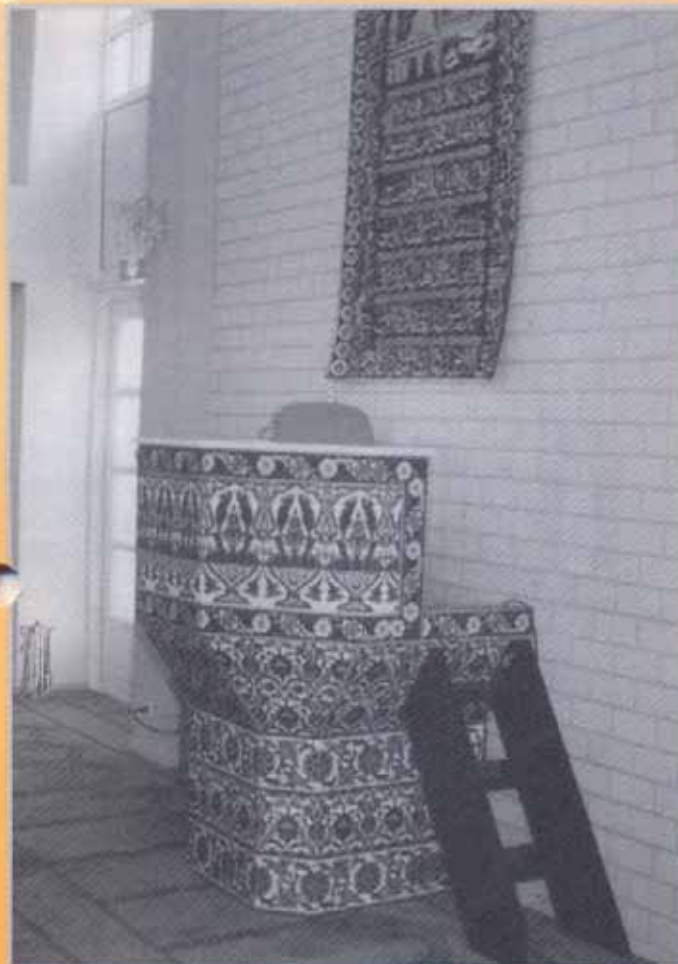
(Links) De prachtig versierde kleine kansel

het gebed zeg je drie heel belangrijke zinnen. Elke zin zeg je 33 keer, in totaal kom je dan op 99 zinnen. Telkens als je een zin hebt opgezegd, verschuif je een kraal. Als je alle kralen verschoven hebt, ben je klaar met je gebed. De drie zinnen zijn: 'Dankbaarheid aan Allah dat je nog leeft, Dankbaarheid aan Allah dat je gezond bent' en je besluit het gebed altijd met 'Allah is de grootste'.