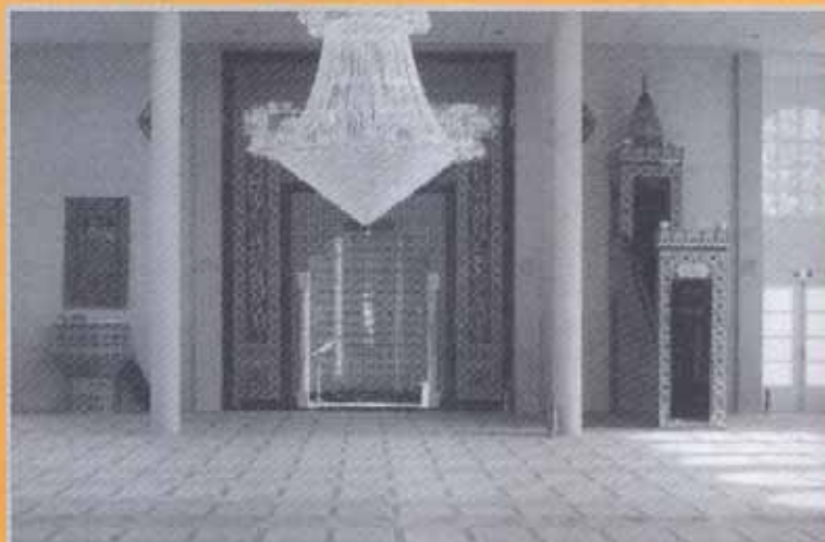
De beide kansels in de moskee