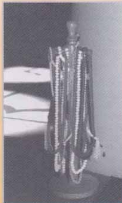
(Boven) De 'kapstokjes' met kettingen

nooit waar je met je schoenen in bent gaan staan. Wat een mooie ruimte is dit, er hangt een schitterende lamp in het midden van de zaal. Vooraan in het midden is een kleine ruimte. Daarnaast staat aan beide zijden een kansel. De kleine ruimte is voor de imam, de voorganger. Deze ruimte staat altijd in de richting van Mekka. De grote kansel wordt gebruikt bij de diensten op vrijdag en op feestdagen. De kleine kansel wordt bij de dagelijkse diensten gebruikt. Het valt me op dat er overal kapstokjes met kettingen op de vloer staan. Het zijn gebedssnoeren. Ze hebben allemaal 99 kralen. De kettingen worden gebruikt als geheugensteun, tijdens